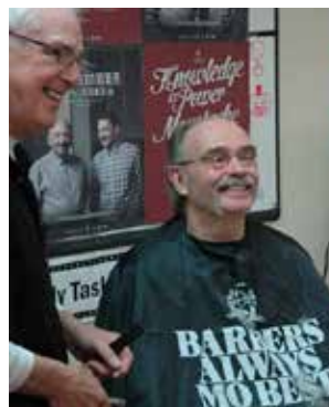
De l'ACSM PEI 'raser' événement à Charlottetown pour démarrer Movember

Le début de novembre marque le lancement de Movember, une campagne de collecte de fonds qui met les hommes au défi de se laisser pousser la moustache, afin de changer leur apparence ainsi que le visage de la santé mentale des hommes. Dans le cadre de sa campagne Movember 2012, Movember Canada a abordé la santé mentale pour la première fois, outre le cancer de la prostate.